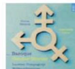
Vivica Genaux / Lawrence Zazzo Baroque Gender Stories