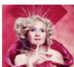
Simone Kermes Inferno e Paradiso