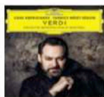
Ildar Abdrazakov Verdi