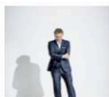
Jonas Kaufmann Wien