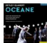
Pesendorfer/Pohl/ Soffel/Bentsson/Haslet/ Schukoff/Brunk