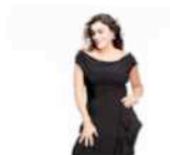
Cecilia Bartoli Farinelli